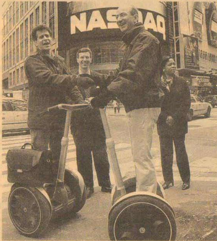
El inventor del Segway, Dean Kamen junto al Ceo de Amazon, Jeff Bezos en una de las presentaciones del aparato en pleno Manhattan.

Las expectativas sobre el Segway eran enormes. Según su creador, pondría en jaque a la industria automotriz. "Será al auto, lo que los autos fueron a los caballos", dijo Kamen a la revista Times. El propio Steve Jobs, el CEO de Apple, lo calificó como el "el invento más revolucionario después del PC". Mientras, el financista del proyecto, John Doerr, anticipó que las ventas llegarían a los US$ 1.000 millones mucho antes que cualquier