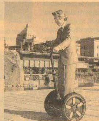
Junichiro Koizumi llega al trabajo en el Segway que le regaló George W. Bush.

Lo verdaderamente revolucionario del invento es la forma cómo funciona. En su interior contiene una serie de giroscopios, sensores de inclinación, microprocesadores de alta velocidad y potentes motores eléctricos, que analizan unas 100 veces cada segundo la "voluntad" de inclinación del usuario. Para hacerlo avanzar, basta con inclinarse ligeramente hacia adelante y para retroceder, hacia atrás. Si se quiere parar, lo único que tiene que hacer es colocarse en posición vertical e inmediatamente se frena. El Segway no tiene frenos y su velocidad, movimiento y detención están controlados por el movimiento natural de quien lo conduce. Todo esto hace "casi" imposible caerse. Y decimos "casi" porque hay quienes tropiezan. ¿El más famoso de todos? El presidente George W. Bush, quien le envió uno de regalo a Junichiro Koizumi. El ex primer ministro japonés, no obstante, supo aprovechar al máximo las potencialidades del aparato.